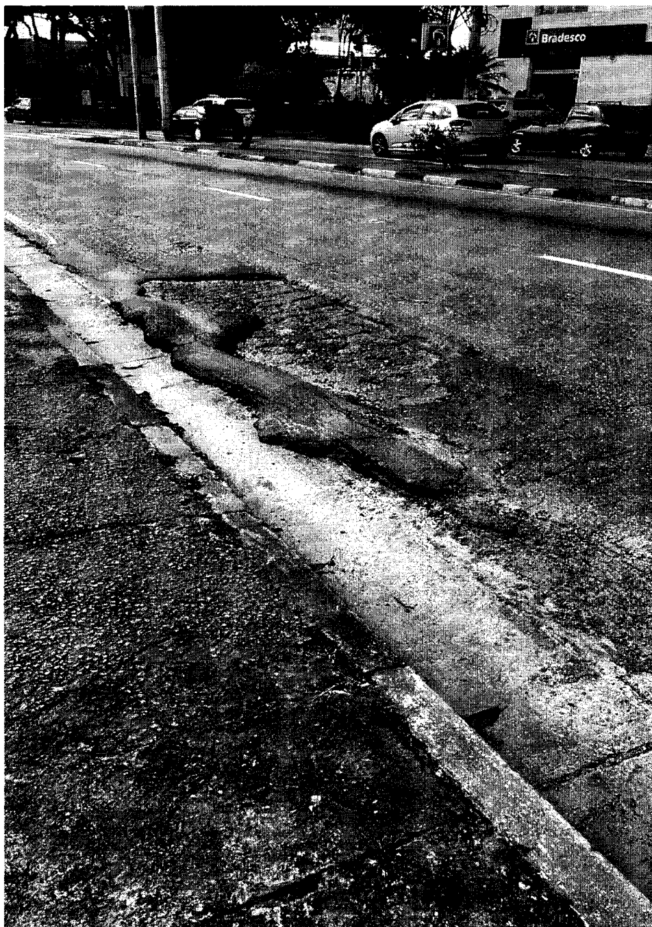
MANUTENÇÃO ASFÁLTICA NA AV. FRANCISCO FERREIRA LOPES EM FRENTE AO BRADESCO, NÚMERO 2737. BRAZ CUBAS